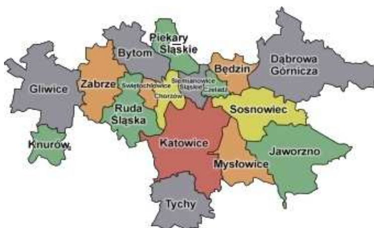
Położenie Sosnowca na terenie aglomeracji miejskiej województwa śląskiego